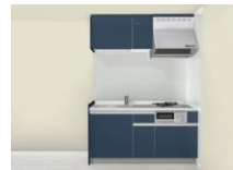
システムキッチン